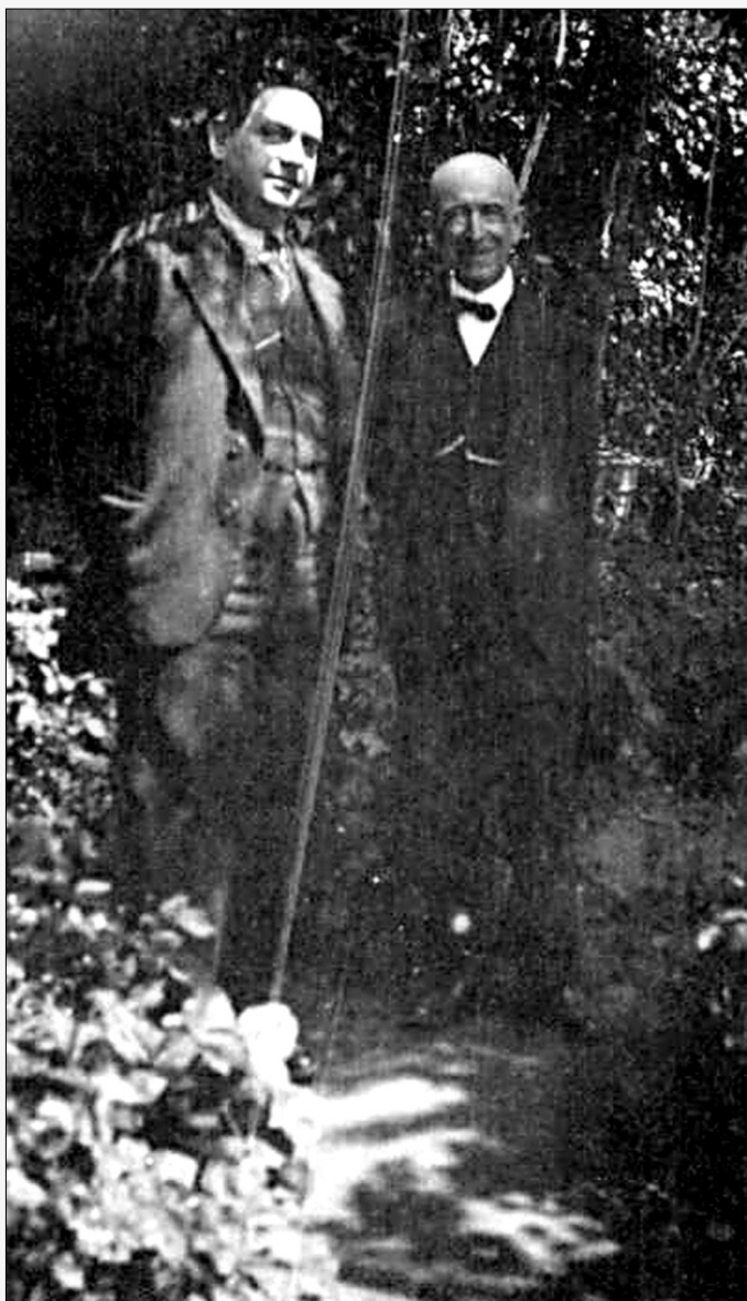
Milhaud y Falla en Granada, 1929.

A la mañana siguiente, Manuel de Falla vino a buscarnos para llevarnos a visitar la Alhambra y el Generalife. [...] Para dirigirnos a su casa, en la Antequeruela Alta, donde nos había invitado a comer, Falla nos hizo pasar por una colina habitada por gitanos que se alojaban en cuevas excavadas en la misma roca. Al acercarnos, viejos y niños acudían con la mano extendida. Se distinguían por todas partes siluetas típicas: faldas de vuelo, amplios chalés,