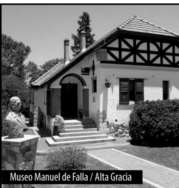
Museo Manuel de Falla / Alta Gracia