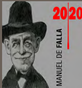
Ilustración musical del Conservatorio Superior de Música "Manuel de Falla"