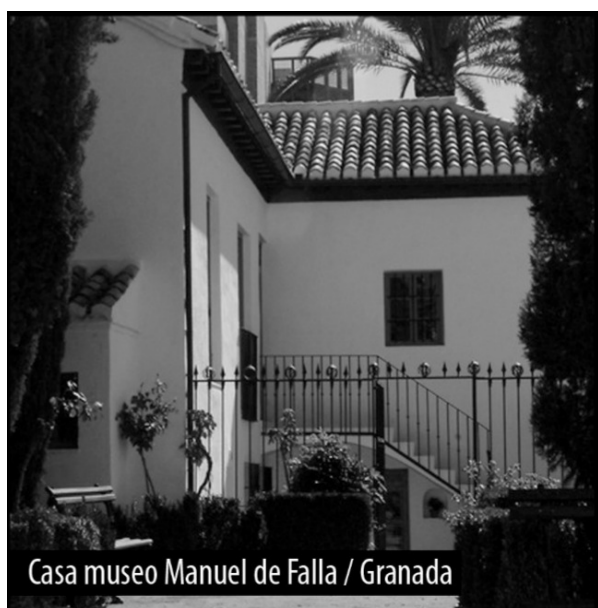
Casa museo Manuel de Falla / Granada