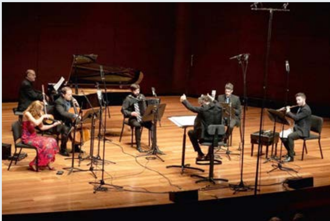
Concierto del 36º Premio de jóvenes compositores, 2025.

Colabora Fundación Archivo Manuel de Falla