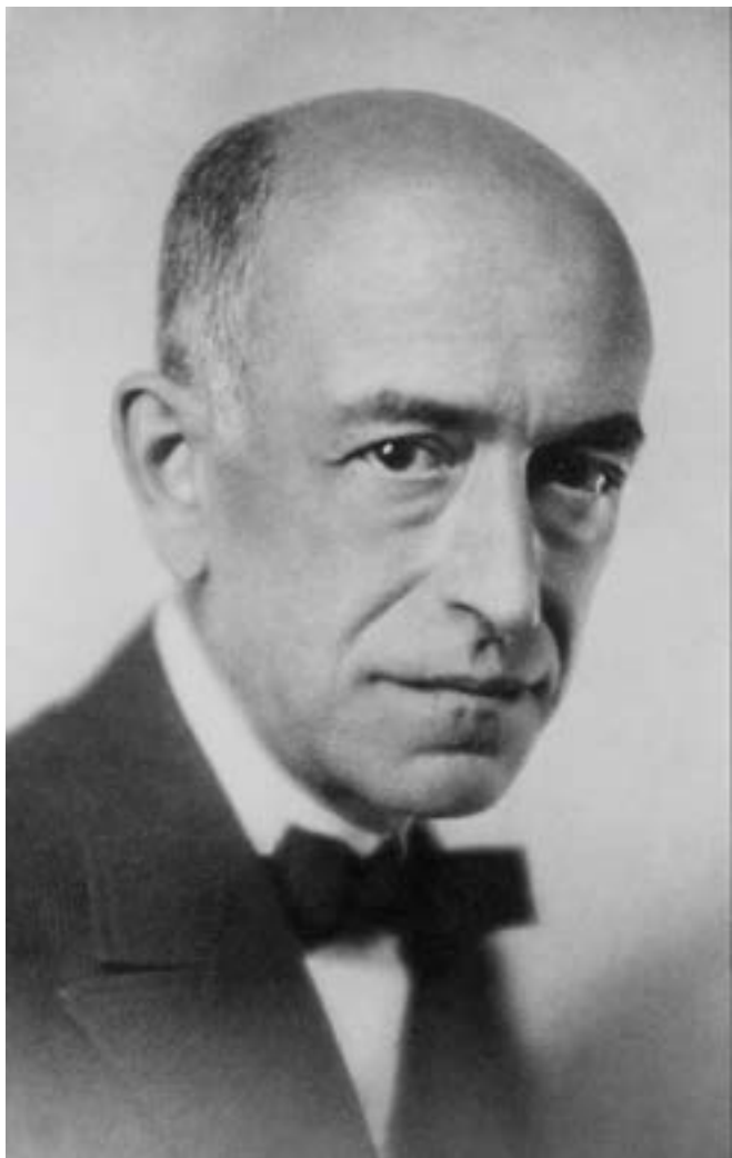
Manuel de Falla (ca. 1928).

Editorial Comares Editorial Universidad de Granada Archivo Manuel de Falla