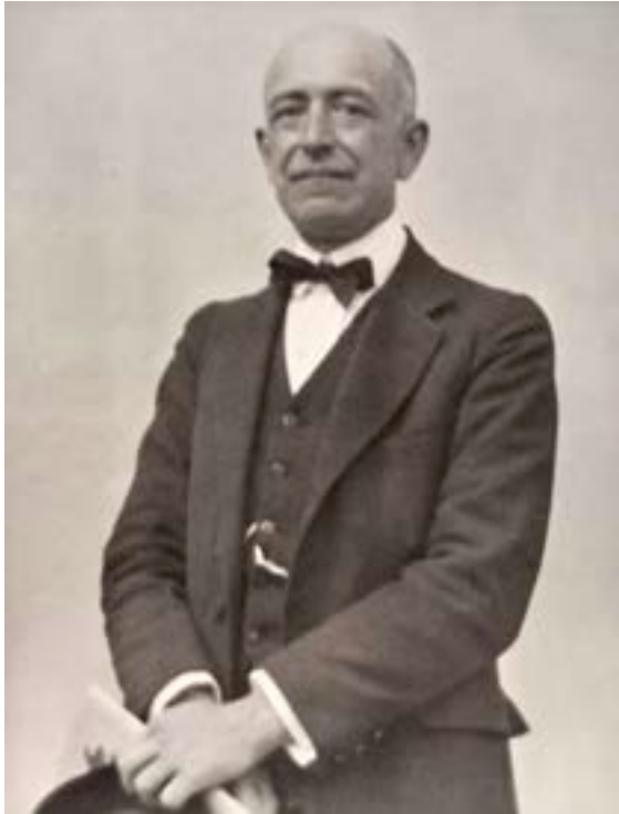
Manuel de Falla (ca. 1926).