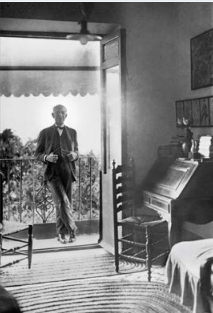
Manuel de Falla en su casa de la Antequeruela. Granada, ca. 1930 Archivo Manuel de Falla.

El 8 de marzo de 1991 abrió sus puertas el Archivo Manuel de Falla en Granada —ciudad elegida por el compositor para fijar su residencia en 1920—, ubicado en la colina de la Alhambra, dentro del Centro Cultural Manuel de Falla y a pocos metros de su Casa Museo. A lo largo de la temporada 2026/27, las tres instituciones que comparten sede (Centro Cultural Manuel de Falla, Orquesta Ciudad de Granada y Archivo Manuel de Falla) trabajarán conjuntamente bajo el nombre “Espacios para un músico” en una serie de visitas especializadas, conciertos participativos y actos institucionales que darán visibilidad a esta serie de espacios vivos de creación cultural tan estrechamente ligados a Manuel de Falla.