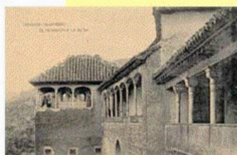
Tarjeta postal del Peinador de la Reina en la Alhambra.