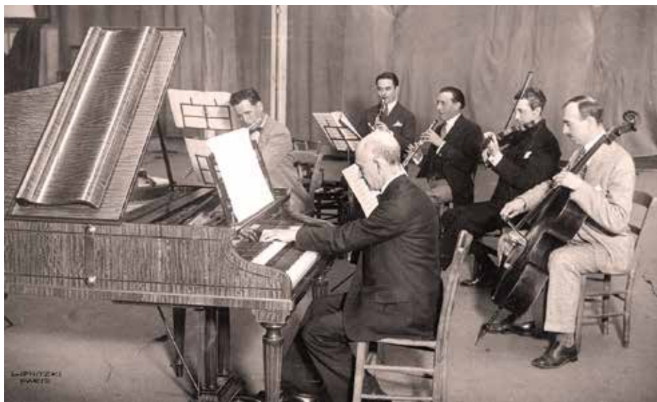
Manuel de Falla al clave durante la grabación del Concerto . París, junio 1930.