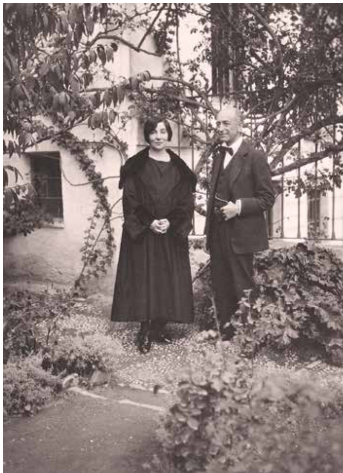
Wanda Landowska y Manuel de Falla en el carmen de la Antequeruela. Granada, 1922.