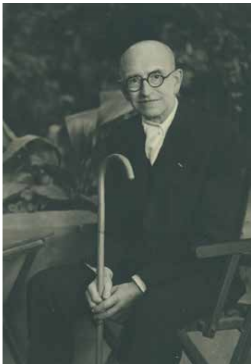
Manuel de Falla, 1937.