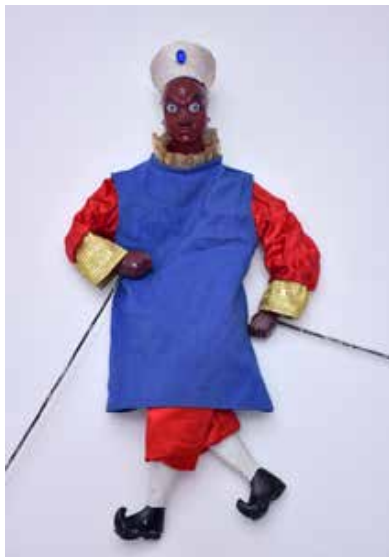
Títere para El retablo de maese Pedro . Taiwán, 1995.

Original puesta en escena con músicos y cantantes españoles y títeres orientales, diseñados artesanalmente y dirigidos por uno de los mejores titiriteros de Taiwán. Representarán también una popular leyenda con música tradicional taiwanesa, que cuenta la historia de una niña secuestrada por un malhechor, que es salvada por un chico erudito, que parece más un buen estudiante que un luchador. La valentía del chico, que está en el lugar y en el momento adecuado, puede calificarse de milagro. El padre de la niña, profundamente conmovido, pide al valiente muchacho que se case con su hija.