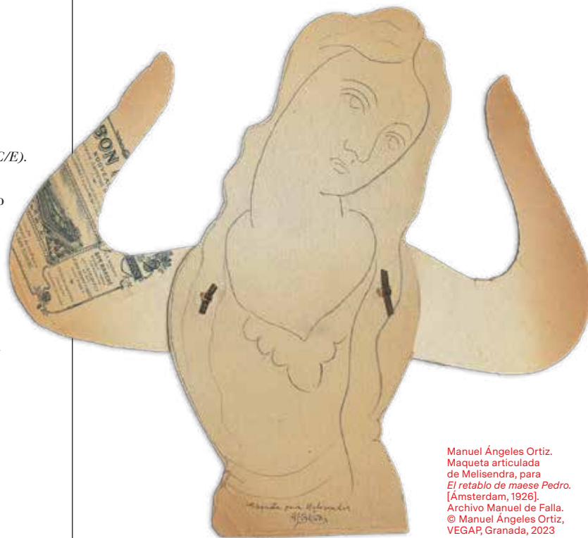
Manuel Ángeles Ortiz. Maqueta articulada de Melisendra, para El retablo de maese Pedro. [Ámsterdam, 1926].